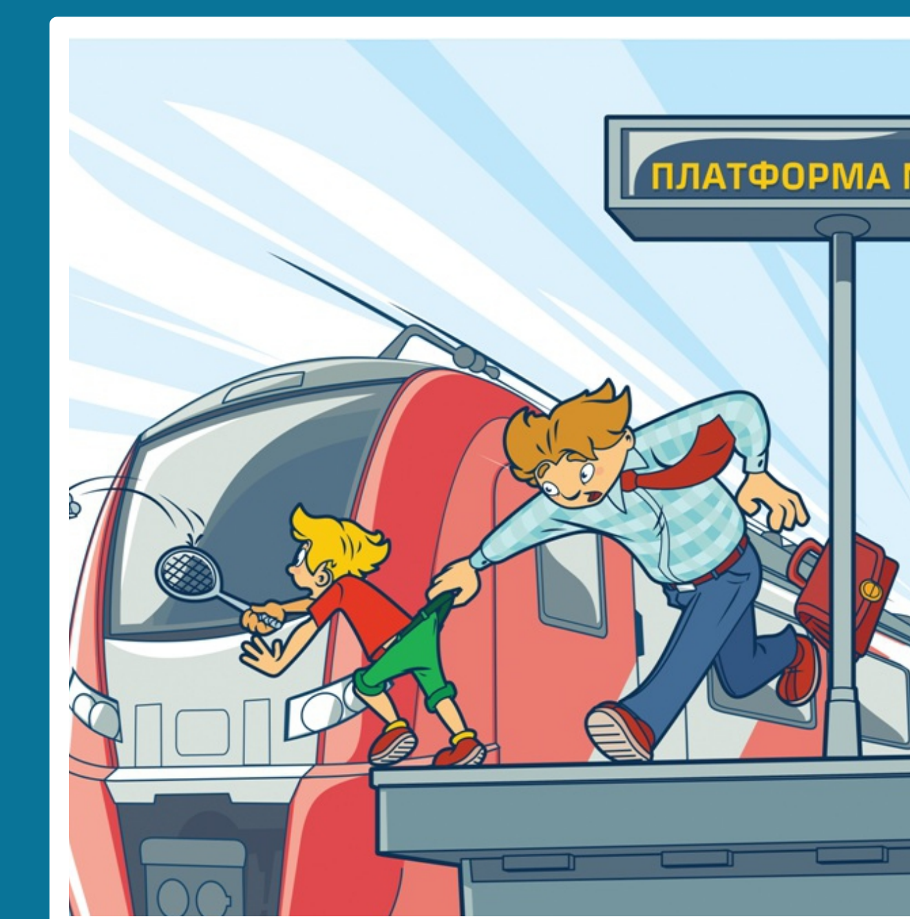
Платформа - не место для игр!