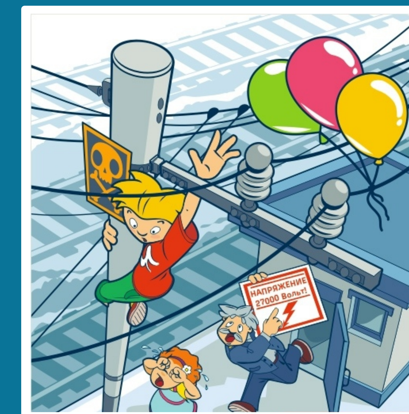
Приблизиться к проводам меньше чем на 2 метра - смертельно опасно!