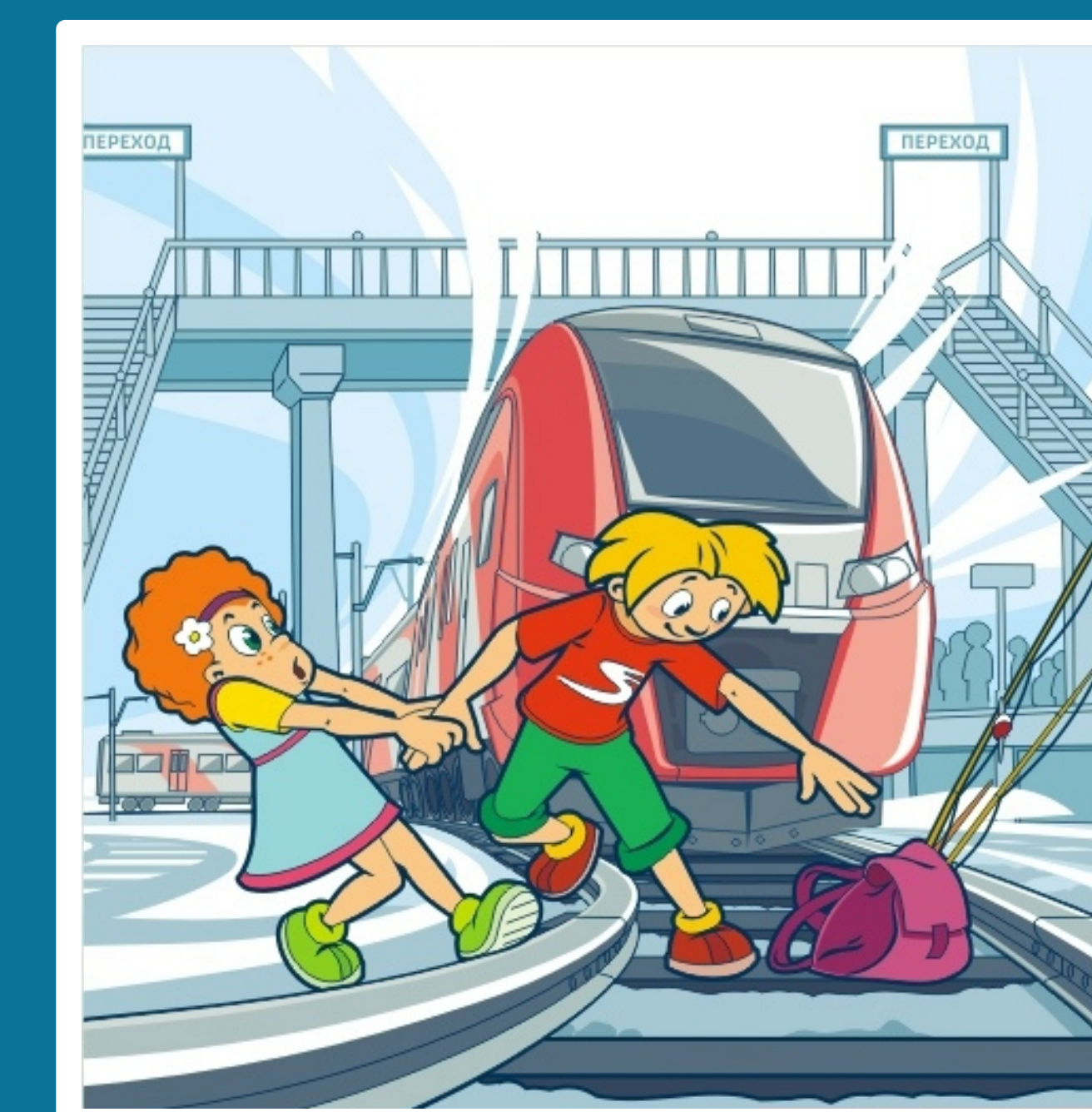
Нельзя переходить пути в неполюженном месте!